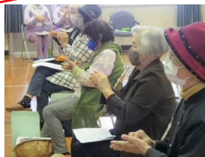
豊後大野市役所 田北保健師