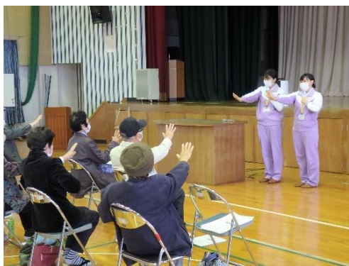
実習生の藤華医療技術専門学生 によるレクリエーション